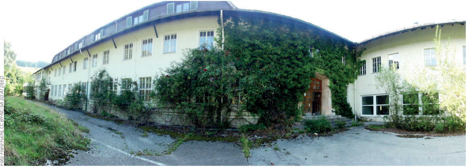
Seit fast 15 Jahren verfällt die ehemalige Landwirtschaftsschule Weyregg. Nun soll dort eine private Pflegeschule entstehen oder doch was anderes?

Es läge am Koalitionspartner und allen voran LH Stelzer, mit dem blauen Gegenüber Klartext zu reden, aber auch das Identitären-Problem zur Chefsache zu erklären und dem Kampf gegen den Rechtsextremismus Durchsetzungskraft zu verleihen. Es geht um unsere Grundwerte und den Ruf Oberösterreichs.